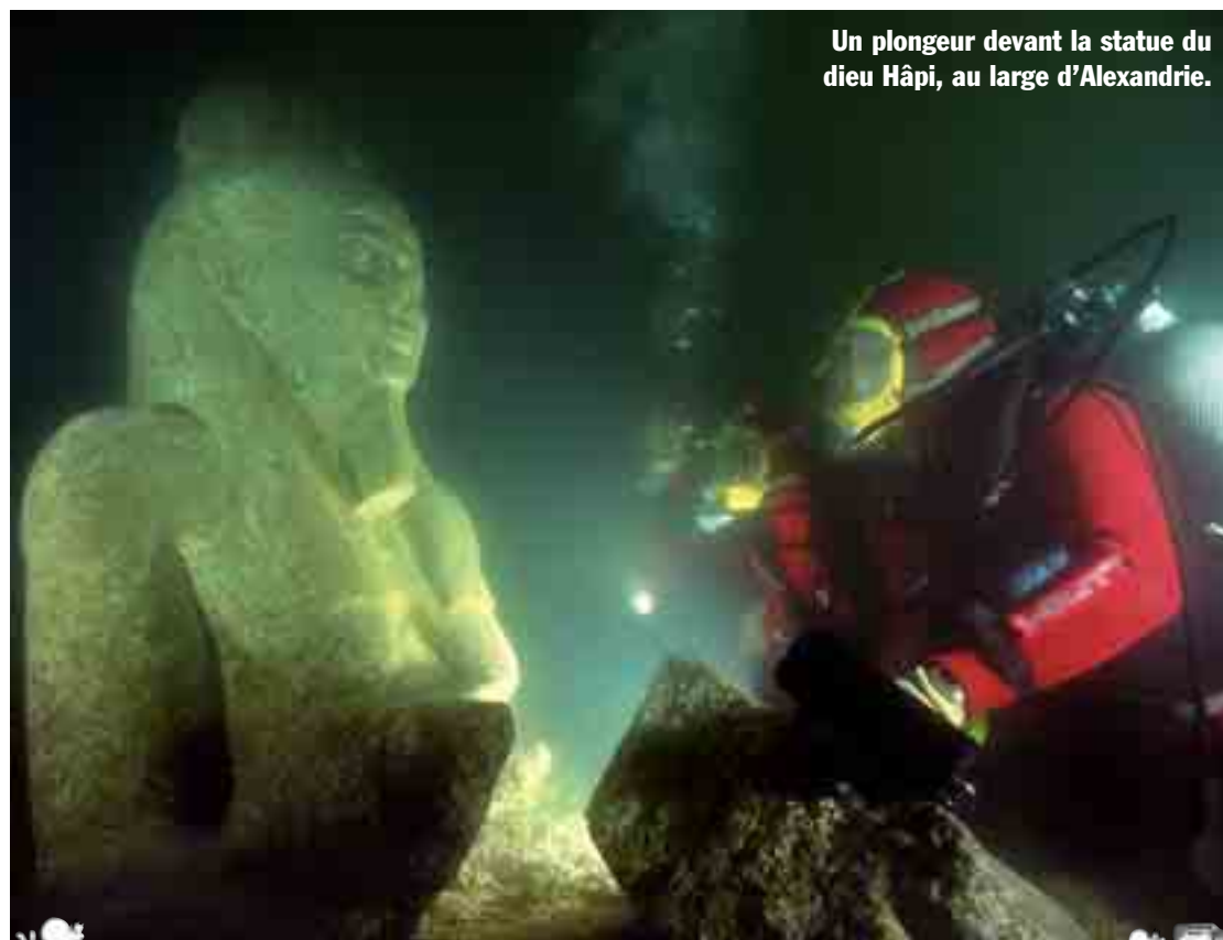
Un plongeur devant la statue du dieu Hâpi, au large d'Alexandrie.

À Berlin, en Allemagne, un musée présente 500 objets qu'un plongeur archéologue est allé chercher dans les eaux égyptiennes. pp. 2-3